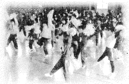
ダンス「ジャンボリー・ミッキー」（1年）