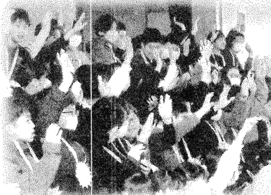
楽しみながら演技を鑑賞しました