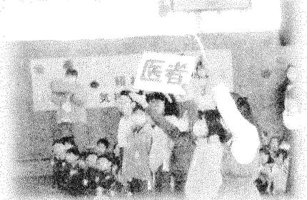
6年担任の先生に関係したクイズ（3年）