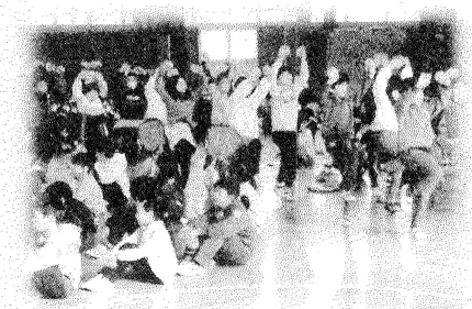
6年生に教えてもらったさんさを披露（2年）