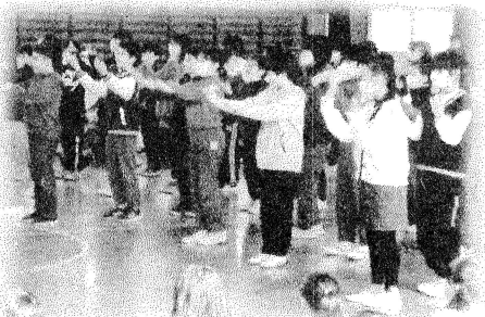
歌「パプリカ」で気持ちを伝えました（5年）