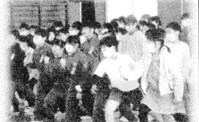
縄跳びなどで、6年生に挑戦！（4年）

優しく、頼れる6年生へ伝えたい気持ちは「感謝」。この気持ちを胸に「6年生を送る会」が2月20日（火）に行われました。新児童会運営部の子どもたちを中心に、学年ごとに役割を分担して準備から本番まで、協力し合いながら取り組んできました。心のこもった手紙や招待状、プレゼント、会場の飾りつけ、そして出し物や演技にも、6年生に伝えたい感謝の気持ちがあふれていました。また、6年生からは、お礼の気持ちのこもった歌のプレゼントもありました。さらに、5年生と6年生のエール交換の場面もあり、本宮小の伝統がしっかりと引き継がれている様子を見ることができました。コロナ対応が緩和となり、数年ぶりの一堂に会した「6年生を送る会」でしたが、お互いに思い合う「宝積」の心で温かいひとときをともに味わうことができました。この成果を活かして、次につながる1年の締めくくりとなる3月にしてほしいと思います。