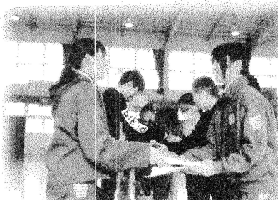
児童会運営部と委員会の引き継ぎ式