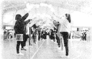
6年生入場 感謝の気持ちで迎えました