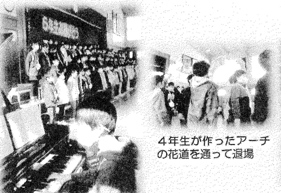
4年生が作ったアーチの花道を通して退場