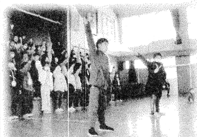
6年生からの心のこもったエールと歌のおかえし