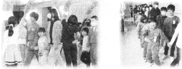
6年生のお兄さんやお姉さんと一緒に入場しました