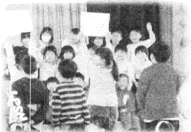
本小クイズに挑戦! 学校生活が楽しみに...

4月25日(木)に「1年生を迎える会」が児童会主催で行われました。6年生のお兄さん、お姉さんに手を引かれ、少々緊張した表情で入場した1年生の子どもたちでしたが、各学年から本宮小学校の暮らし方や学校行事などについて、クイズや踊りなどを交えて、楽しく、分かりやすく教えてもらいました。そして、1年生からのお礼の歌の発表。全校から温かい拍手が送られ、体育館全体が温かい(幸せな)空気に包まれました。