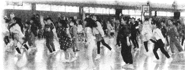
ダンスを交えながら、学習について紹介しました