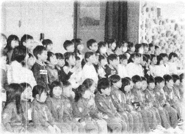
お兄さんお姉さんの発表に目が釘付けです