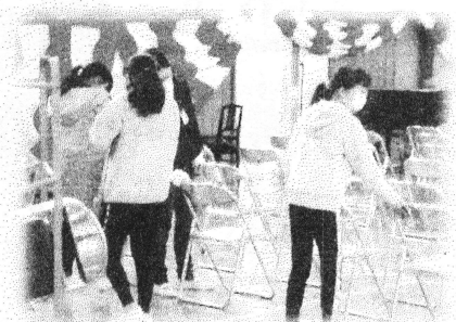
働き者の6年生。入学式準備を心を込めて