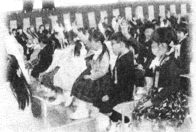
やる気も元気も笑顔もいっぱいです

また、入学式では児童会運営部による「1年生歓迎セレモニー」も行われ、学校での過ごし方について教えてもらいました。なお、前日には6年生全員で心を込めて準備を行いました。