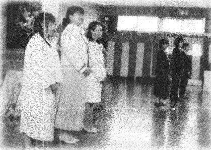
よろしくお願いします