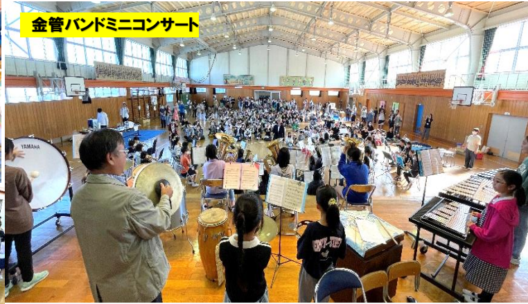
金管バンドミニコンサート