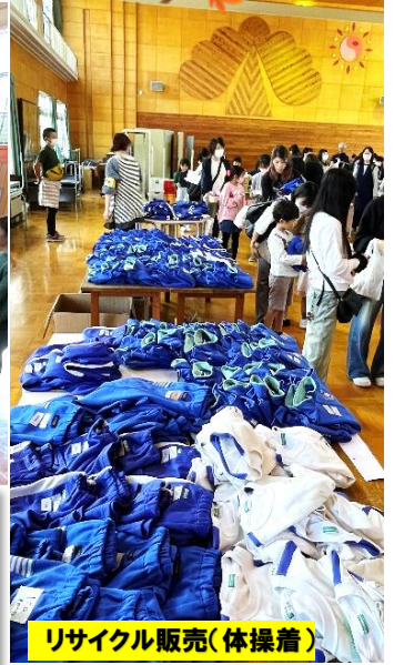
リサイクル販売(体操着)