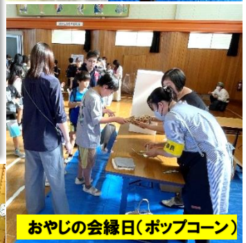
おやじの会縁日(ポップコーン)