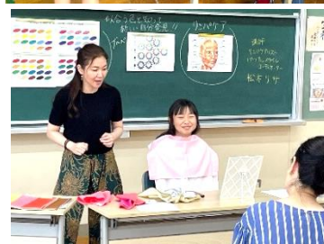
家庭教育学級講座「パーソナルカラー」