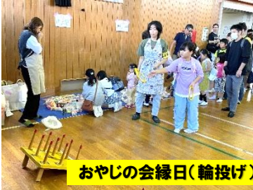
おやじの会縁日(輪投げ)

10月5日(土)の午前中、本小 PTA まつりが開催されました。本小まつり運営部の皆さんをはじめ、おやじの会、ボランティアの皆さん総勢47名の方々からご協力いただきました。ありがとうございました。