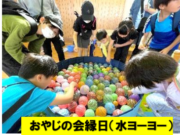
おやじの会縁日(水ヨーヨー)