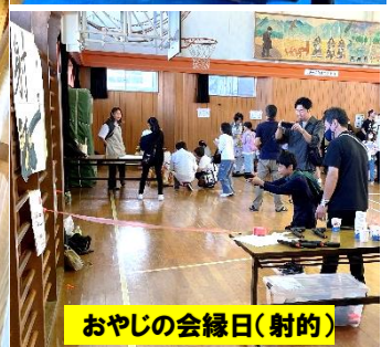
おやじの会縁日(射的)