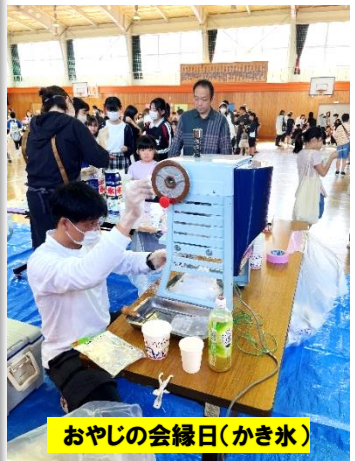
おやじの会縁日(かき氷)