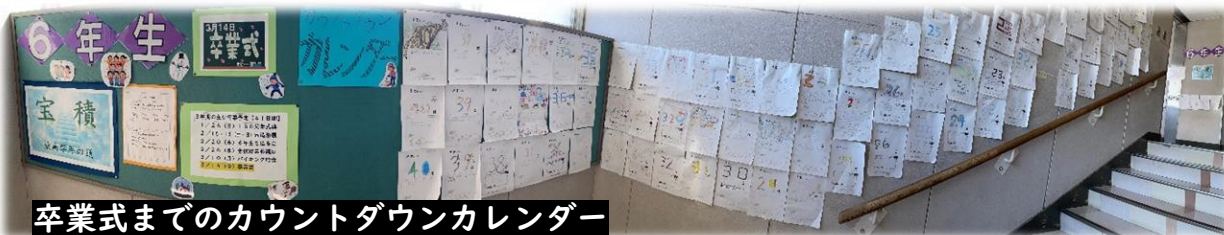
卒業式までのカウントダウンカレンダー

これもひとえに、ご家庭や地域の皆様のご理解とご協力の賜物です。本当にありがとうございました。この成長を新しい学年や中学校の生活に一人一人つなげていってほしいと願っています。おうちの方におかれましては、今年度同様来年度も引き続きご理解ご協力を賜りますようよろしくお願いいたします。