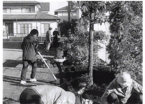
「みんなの稲荷公園」の清掃活動

見た目は素人丸出しですが、町内会への回覧物・掲示文書などが必要な時に参照でき、町内会の活動予定や、本宮地区の関連行事等のスケジュールも参照できます。