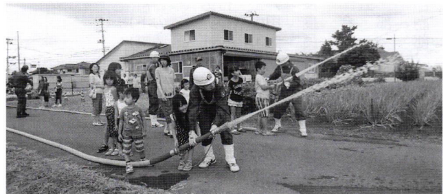
三世代交流と一緒に実施した消火訓練